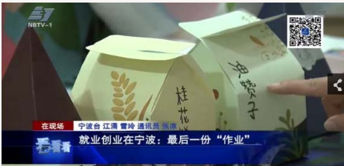
宁波电视台报道我校毕业作品设计展