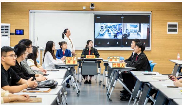
共享法庭 + 模拟法庭

创新教学观摩空间、移动教学增强空间、团队合作探究空间、远程互动共享空间、多视窗沉浸式互动空间、多视窗协作探究空间、多视窗灵动交互空间、智能资源制作空间、研讨型空间、大数据驾驶舱。