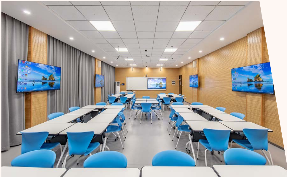
创新教学观摩空间

学校以信息技术与教育教学深度融合为突破口，大力推进数智课堂实验区建设，不断提高课程教学目标达成度和学生课堂教学满意度：