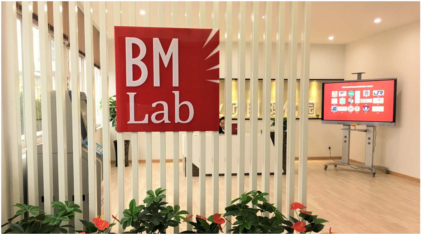
商业模式实验室（国家级众创空间）