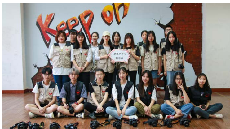
大学生融媒体中心团队