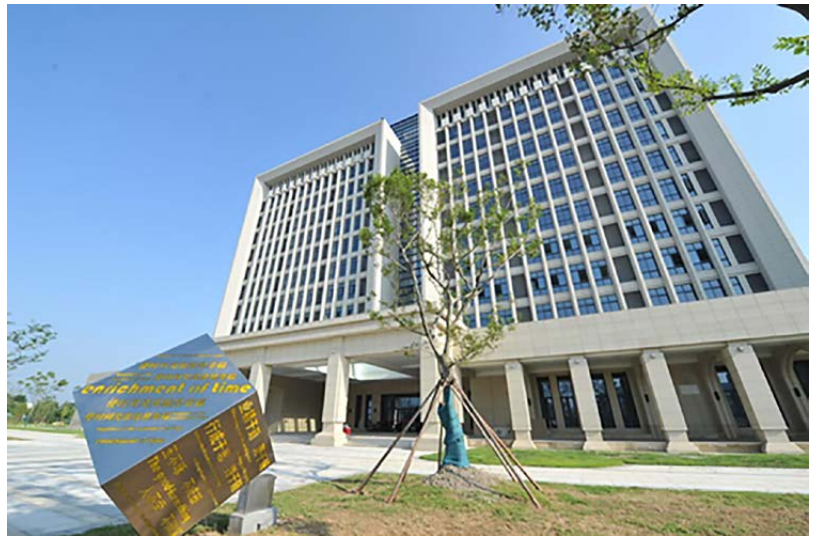
科创大楼（杭州湾校区）

2018 年以来，我校创业学院成为浙江省首批“普通高校示范性创业学院”，在校企联合 8 年实践探索的基础上，领先申报了“创业管理”本科专业，填补了创业人才培养本科教育的空白，自主开发的专业课程《创业实践与实战》被评为国家级一流本科课程，商业模式实验室获评国家级“众创空间”。