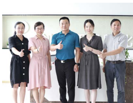
创新“模”范教学团队的《创业实践与实战》获首批国家级一流本科课程（社会实践）