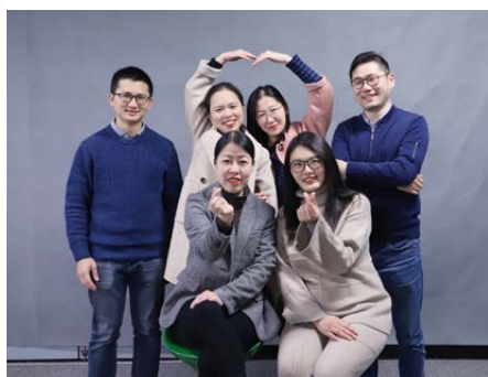
“E 术助商”教学团队的《面向对象程序设计》获首批国家级一流本科课程（线上线下混合）