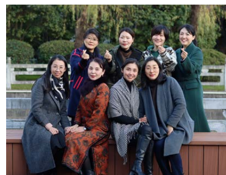
思行慧心教学团队持续深入大思政课建设，课程教学辐射影响至中小学及其他公益组织