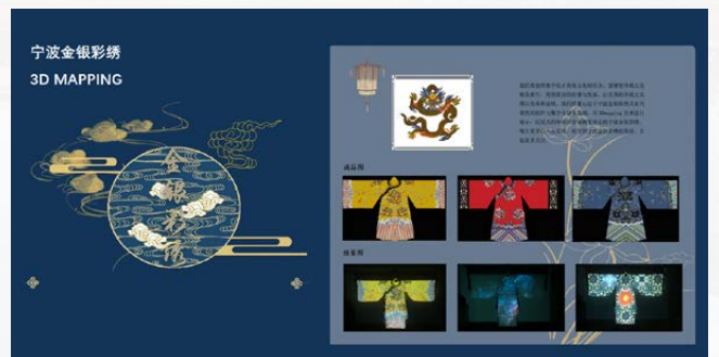
学生作品 - 宁波金银彩绣