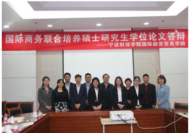
与江西财经大学联合培养国际商务硕士生答辩