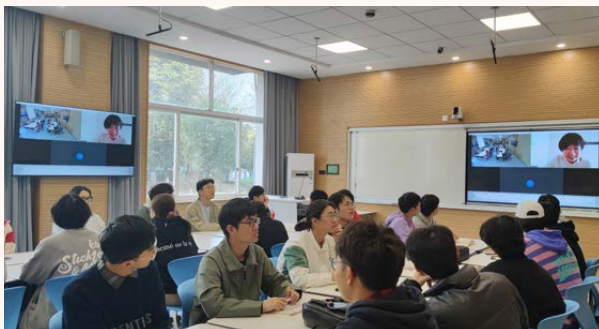
日本横滨大学名师进课堂