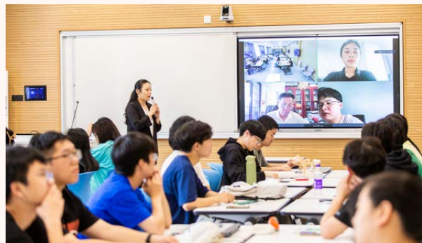
名师企业家校友共上一堂课