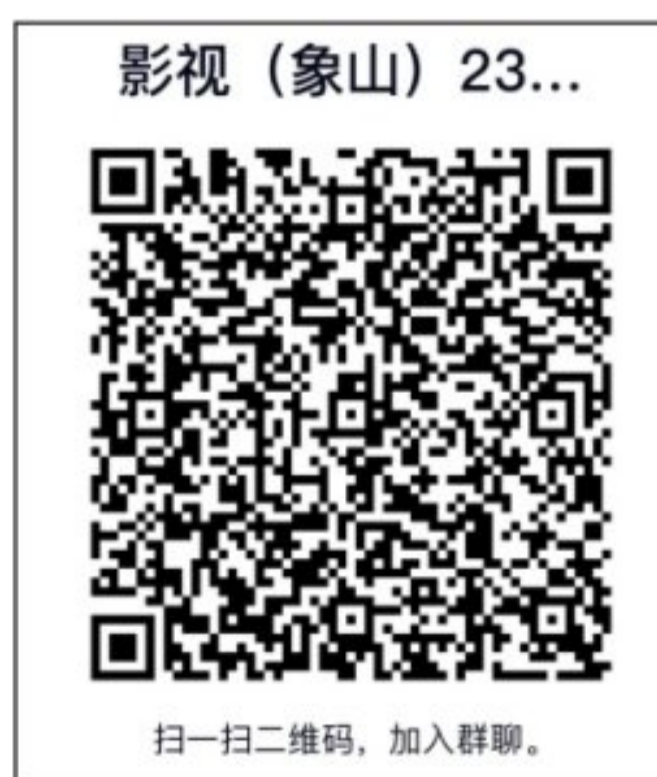
象山影视学院（象山校区）