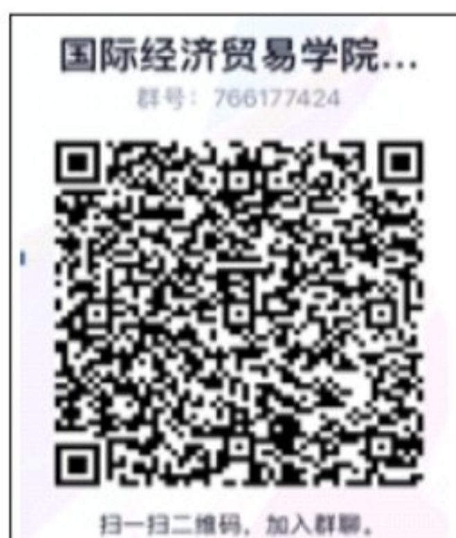
国际经济贸易学院